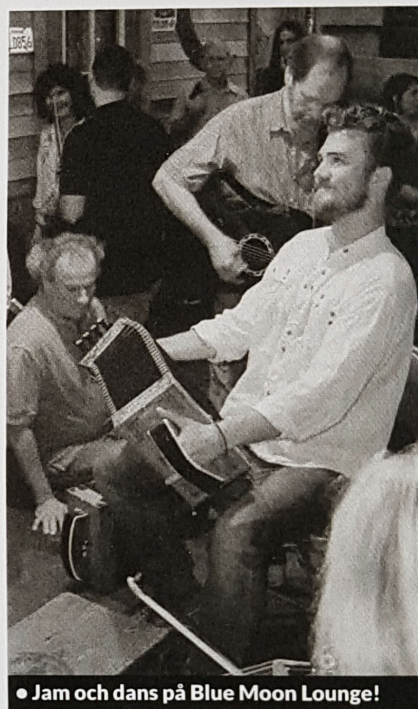
● Jam och dans på Blue Moon Lounge!

till Lafayette och jag har nu fått ett nytt barn – ett Acadianskt sådant.