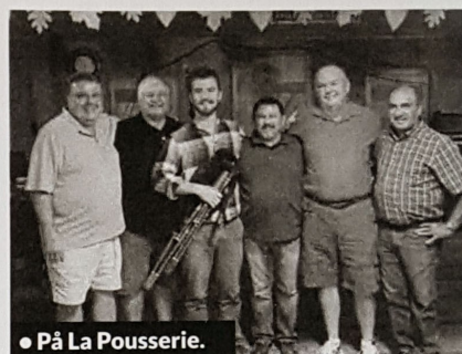
● På La Pousserie.