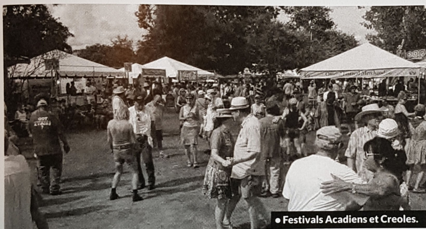
● Festivals Acadiens et Créoles.